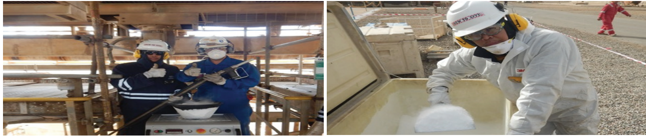
■ خالد سمير غزال - كبير مهندسي العمليات (الإدارة الفنية) ■ بريك عايض العتيبي - مشرف تنفيذ المشاريع (إدارة الصيانة)