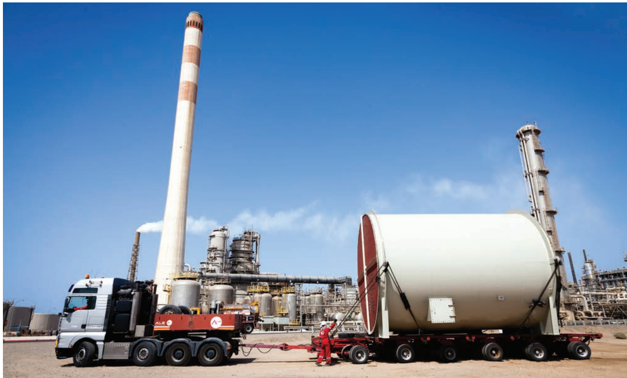
■ Abdullah Namankani, TA Projects Engineering Coordinator

The potential of waste heat recovery has attracted the attention of industries for decades with ultimate results of considerable cost saving at first hand and lowering emission on the other hand. Pursuing such objectives, it is envisaged to install Waste Heat Boiler to recover the heat from Flue Gases being released to atmosphere otherwise. SAMREF Waste Heat Boiler (WHB) project will utilize this vented (wasted) flue gases @ 400°C temperature from Crude and Vacuum Unit Furnaces alone. An estimated 50 Tons per hour High Pressure Steam Production is expected from the Designed Waste Heat Boiler unit, The project implementation is phased into 2018 TA and post TA installation. The Flue gas duct Tie-Ins are planned to be completed during 2018 TA.