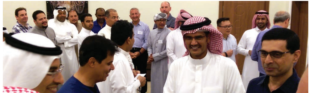
■ هابوارالتشنتشي - تأكيد وضبط الجودة

أجري بنجاح خلال الفترة من ٢٣ إلى ٢٧ يوليو ٢٠١٧م التقييم النهائي للإستعداد لإنطلاق أعمال الصيانة الدورية الشاملة لعام ٢٠١٨م بشركة سامرف، حيث زار الشركة فريق ضم ٩ من الخبراء المختصين في مختلف التخصصات تابعين إلى شركات إكسون موبيل في أوروبا وآسيا وباشروا أعمالهم مع نظرائهم في فرق عمل شركة سامرف المشاركين في الصيانة الدورية. وشكل الفريق الزائر ٤ فرق عمل شملت تقييم الجاهزية في مجالات الإدارة والتخطيط والمشاريع والعمليات، كما حرص الخبراء على تبادل الخبرات مع المعنيين في سامرف بينما تمت عملية التقييم بصورة سلسلة وودية سادتها الشفافية والتعاون بغية الحصول على أفضل نتائج في هذا التقييم الخارجي الهام للأعمال التي تم إنجازها.